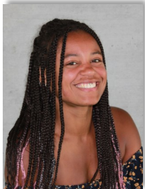
Jil Ullmann Kindergarten Blumenwiese